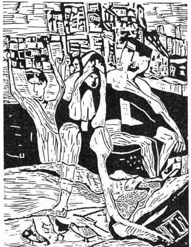
Willy Beppler, Bildplatte aus der Serie "Die Seligpreisungen" mehrfarbig, 60 x 80, 1993

Ziviler Friedensdienst - ein neues Mittel für eine neue Politik