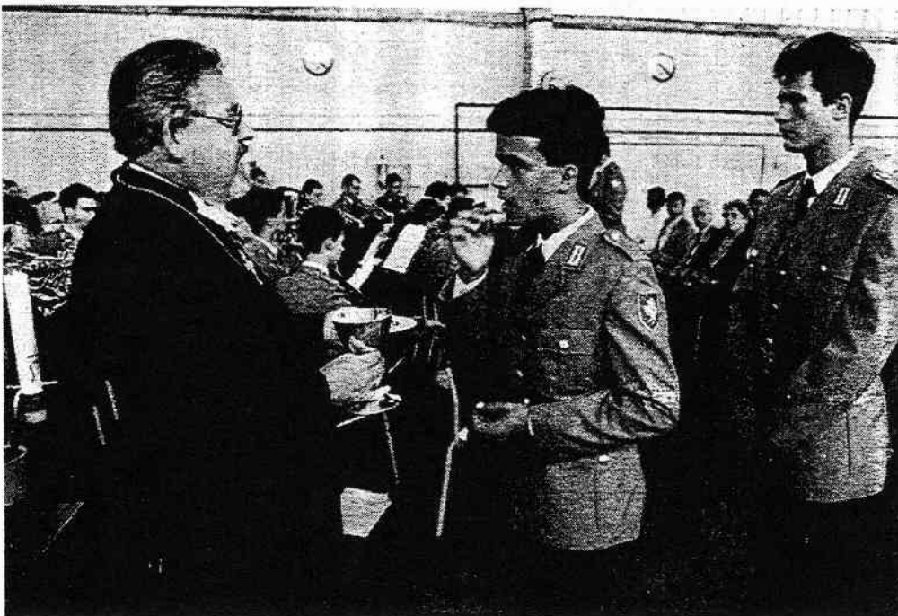
Verkostung der neuen, weltweit einsetzbaren olivgrünen Oblaten