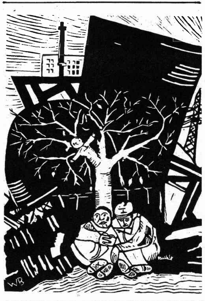
Willy Beppler, "Jesuskind im Baum" 1989

Dokumentation Urteil zu: Bundeswehreinsätze