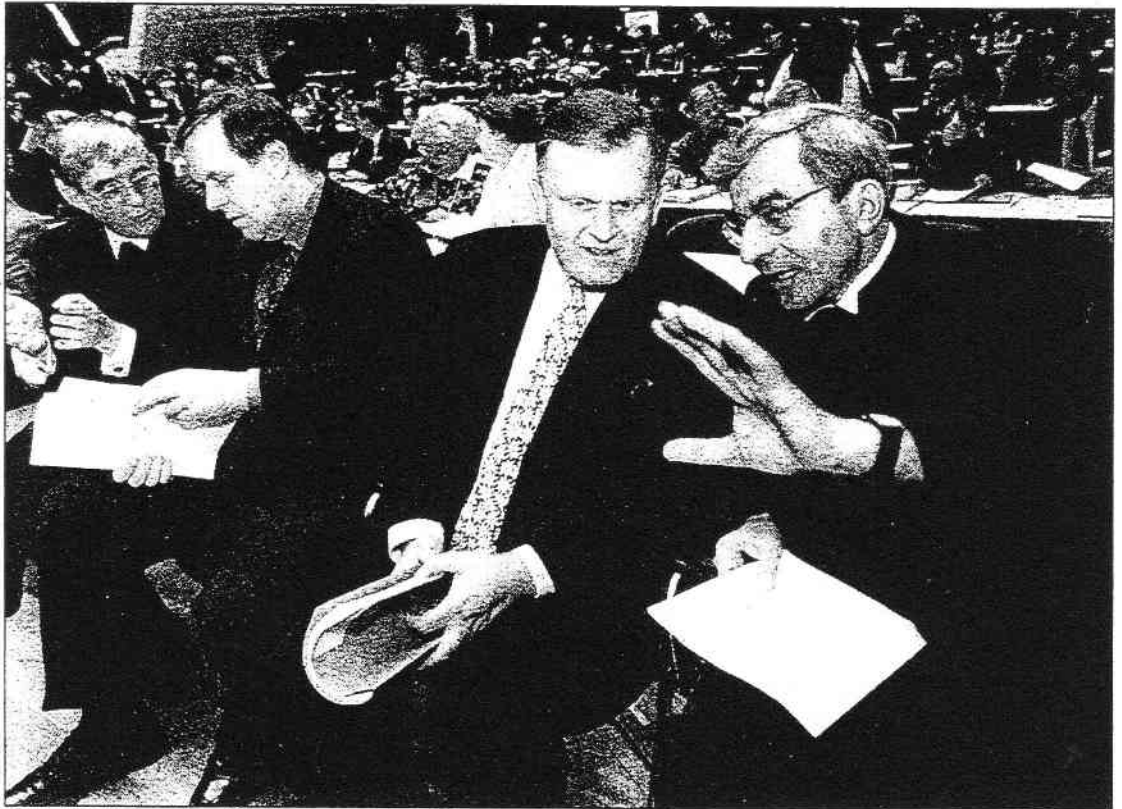
Die Bischöfe Hartmut Löwe (links) und Klaus Engelhardt (rechts) nehmen die Politiker Volker Rühle und Erwin Teufel ins Gebet

An Herausforderungen mangelt es der Kirche wirklich nicht. In Friedrichshafen sucht die Synode der evangelischen Kirche Antworten zu finden auf die schwindende religiöse Sensibilität der Menschen wie auf europaweite und innenpolitische Problemlagen