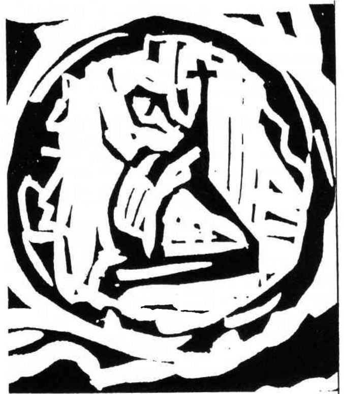
Willy Beppler, Ausschnitt aus der Druckplatte eines mehrfarbigen Bildes Serie "Seligpreisungen", 1993