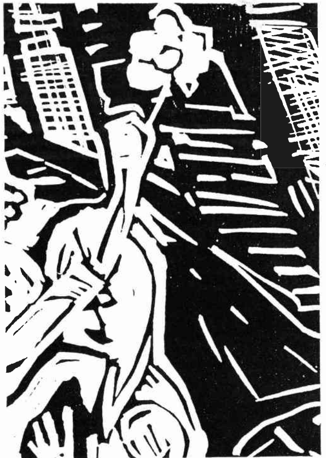
Willy Beppler, Ausschnitt aus der Druckplatte eines mehrfarbigen Bildes Serie "Seligpreisungen", 1993