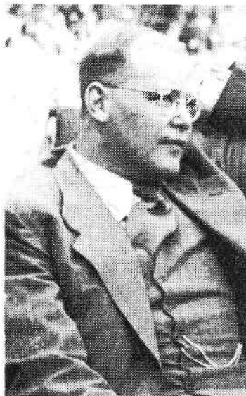
Dietrich Bonhoeffer nach der Rückkehr aus Amerika im Juli 1939 in London

Dietrich Bonhoeffer an der Wende zum Jahr 1943