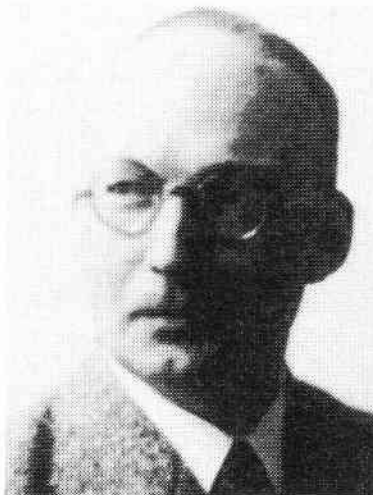
Constantin von Dietze

Groups" befaßten sich mit dem geplanten Wiederaufbau von Wirtschaft und Gesellschaft in den zerstörten Ländern Europas. Die Bekennende Kirche, die nach dem Krieg an diesen Überlegungen sofort beteiligt werden sollte, war auf solche Gespräche nicht im geringsten vorbereitet. Deswegen entschloß man sich in der Leitung der Bekennenden Kirche, auch in Deutschland eine "Peace-Aims-Group" aufzubauen. In