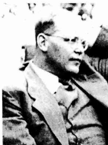
Dietrich Bonhoeffer im Juli 1939

Dietrich Bonhoeffer an der Wende zum Jahr 1943