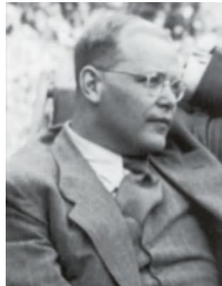
Dietrich Bonhoeffer im Juli 1939

„Ich glaube, dass Gott uns in jeder Notlage soviel Widerstandskraft geben will, wie wir brauchen. Aber er gibt sie nicht im Voraus, damit wir uns nicht auf uns selbst, sondern auf ihn verlassen. In solchem Glauben müsste alle Angst vor der Zukunft überwunden sein.“ Dietrich Bonhoeffer an der Wende zum Jahr 1943