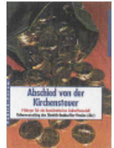
Detlev Bald/ Karl Martin (Hrsg.): Abschied von der Kirchensteuer, Publik Forum, Oberursel, 176 Seiten, 12,80 €