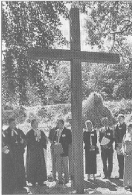
Andacht unter dem Kreuz von Finkenwalde.