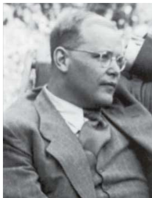
Dietrich Bonhoeffer im Juli 1939

„Ich glaube, dass Gott uns in jeder Notlage soviel Widerstandskraft geben will, wie wir brauchen. Aber er gibt sie nicht im Voraus, damit wir uns nicht auf uns selbst, sondern auf ihn verlassen. In solchem Glauben müsste alle Angst vor der Zukunft überwunden sein.“ Dietrich Bonhoeffer an der Wende zum Jahr 1943