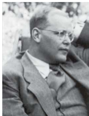
Dietrich Bonhoeffer im Juli 1939

„Ich glaube, dass Gott uns in jeder Notlage soviel Widerstandskraft geben will, wie wir brauchen. Aber er gibt sie nicht im Voraus, damit wir uns nicht auf uns selbst, sondern auf ihn verlassen. In solchem Glauben müsste alle Angst vor der Zukunft überwunden sein.“ Dietrich Bonhoeffer an der Wende zum Jahr 1943