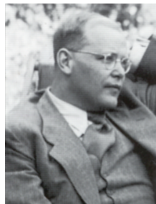
Dietrich Bonhoeffer im Juli 1939

„Ich glaube, dass Gott uns in jeder Notlage soviel Widerstandskraft geben will, wie wir brauchen. Aber er gibt sie nicht im Voraus, damit wir uns nicht auf uns selbst, sondern auf ihn verlassen. In solchem Glauben müsste alle Angst vor der Zukunft überwunden sein.“ Dietrich Bonhoeffer an der Wende zum Jahr 1943