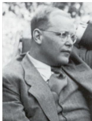
Dietrich Bonhoeffer im Juli 1939

Dietrich Bonhoeffer an der Wende zum Jahr 1943