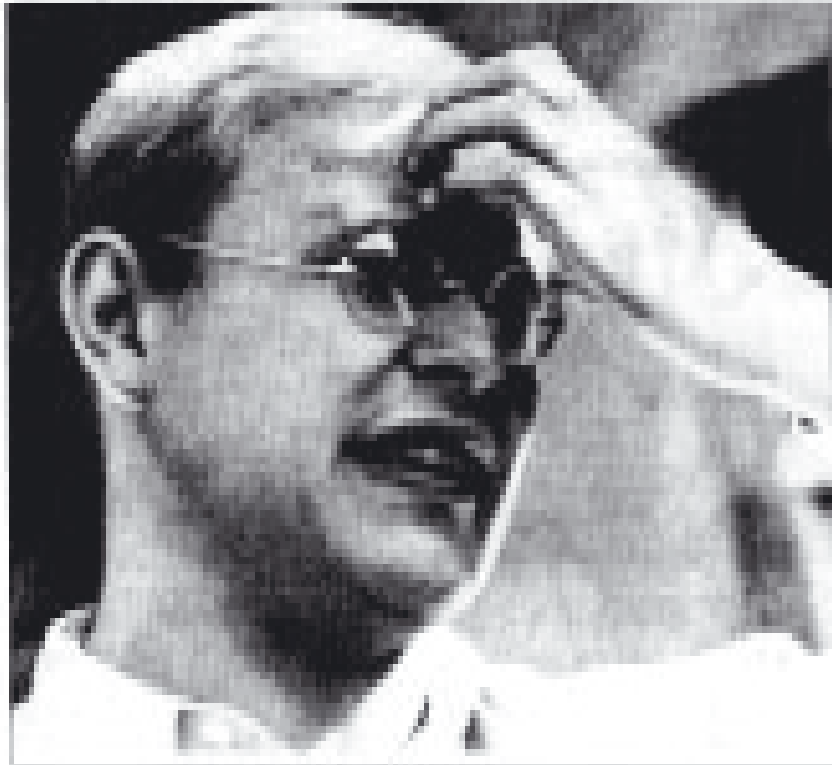
Dietrich Bonhoeffer. Das Bild kann nicht dargestellt werden.

Bonhoeffer - eine theologische Identität? Nicht ganz. Von Bonhoeffer gibt es keine, keine autoritative Lehren wie diese. „Nur in der Kirche Christi der Gegenwart können wir sagen, dass