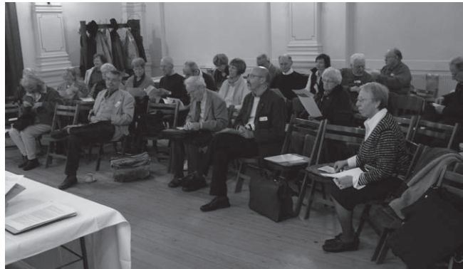
Blick in die Teilnehmerrunde

So sah es auch das gut informierte Publikum, das durch sachkundige Rückfragen und sehr konkrete Erfahrungsberichte von Formen offener und latenter Gewalt im Umgang mit religiösen Minderheiten, die als das „Andere“ und „Fremde“, in allem „Unvertraute“ Angst und Abwehr hervorrufen, die Diskussion wesentlich bereicherte und ihr Tiefe verlieh (gleich dazu vor allem den Bericht über das ‚Podiumsgespräch‘).