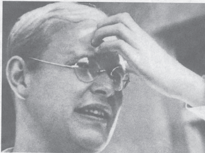
Dietrich Bonhoeffer (1906–1946) – an ihm entzündet jetzt sich eine bizarre Diskussion.

Zunächst wurde die bizarre Äußerung nur verbandintern diskutiert. Dann aber machte ein ehemaliges Mitglied, das 2006 nach Querelen ausgetreten war, sie öffentlich. In gleichlautenden Schreiben alarmierte der Kraftwerksbetreiber Politiker und Behördenvertreter, die am Freitag nach Bad Liebenzell kommen sollten. Die Einschätzung zu Bonhoeffer sei keineswegs ein „Ausrutscher“, sondern vielmehr Ausdruck einer „zunehmend unverhohlen zur Schau getragenen