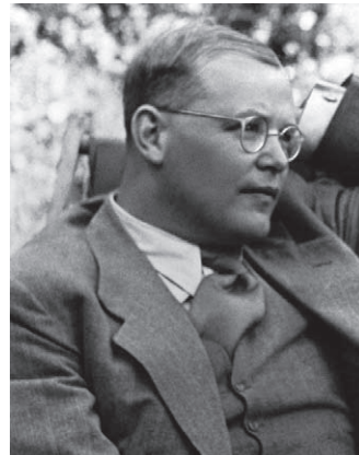
Dietrich Bonhoeffer im Juli 1939

Dietrich Bonhoeffer an der Wende zum Jahr 1943