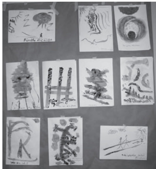
Kaffeegemälde der AG III E: Bildliche Darstellung von Bonhoeffer-Texten.