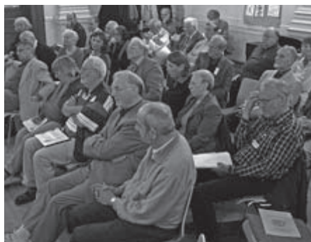
dbv-Herbsttagung in Halle an der Saale: Blick in die Teilnehmerrunde

Die Tagung schloss nach einem recht gelungener Kulturabend (an dem erstaunliche musikalische und künstlerische Talente von sonst eher dem Wort zugewandten Leistungsträgern des dbv zu bewundern waren) mit einem Gottesdienst in der auch von Hallensern sehr gut besuchten Marktkirche ab, in dem noch einmal das Eingangs-Stichwort vom „reichen Jüngling“ aufgegriffen und auf uns selbst (nicht nur auf die ‚anderen‘) bezogen wurde (im Folgenden auch dokumentiert).