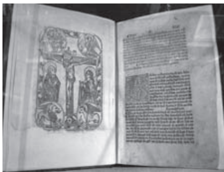
Plenarium (Augsburg: Anton Sorg 1483) aus der Marienbibliothek in der Marktkirchengemeinde

Zwischen 50 und 80 TeilnehmerInnen (Tagesgäste aus Halle kamen zu einzelnen Veranstaltungen dazu) waren vom 24.-26. September dabei. Ein kurzes Einführungsreferat von H.-J. Fischbeck „Die Kirche der ‚reichen Jünglinge‘ – was können wir tun?“ (im Folgenden dokumentiert) am Freitag Abend motivierte die Arbeitsgruppen, den ganzen Samstag intensiv miteinander zu diskutieren, auch Statements/Resolutionen zu verfassen, die am Abend im Plenum vorgestellt wurden, aber nicht mehr diskutiert werden konnten. Wir dokumentieren die Arbeitsergebnisse der Gruppen und auch die Statements, die ihren Wert in sich haben, jedoch nicht als offizielle „Resolutionen des dbv“ begriffen werden können.