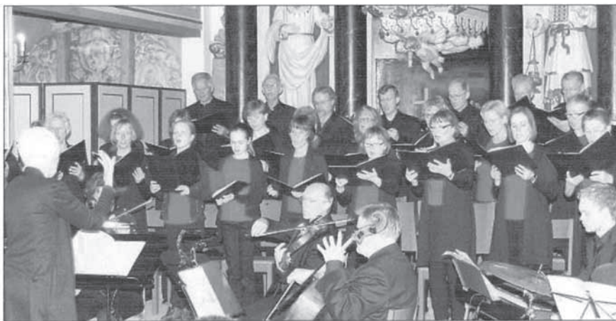
KONZERT: Der Kirchenchor aus Burgdorf gab in der Trinitatiskirche ein Oratorium in Erinnerung an Dietrich Bonhoeffer.

Niedersächsischer Kirchenchor führte Liedoratorium auf und fand in Kurstadt ein begeistertes Publikum