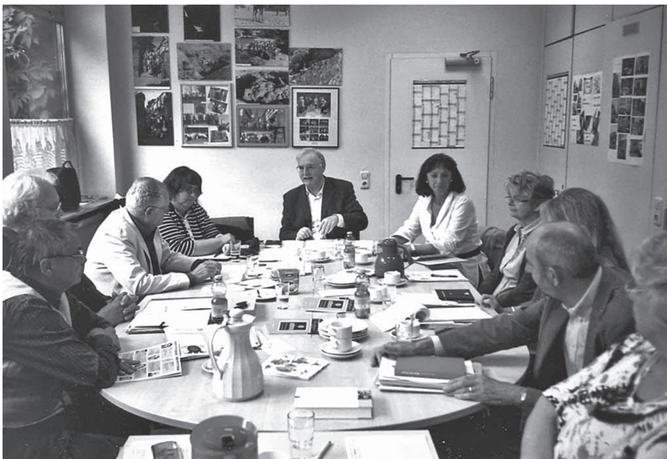
Sitzung des Gesamtvorstands im Juni 2010 in Frankfurt/Main