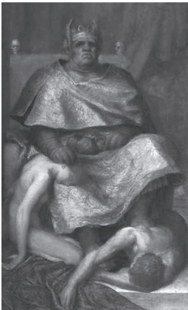
George Frederic Watts 1884: Mammon – Dedicated to his Worshippers

Matthäus 6,24: „Niemand kann zwei Herren dienen: Entweder er wird den einen hassen und den andern lieben, oder er wird an dem einen hängen und den andern verachten. Ihr könnt nicht Gott dienen und dem Mammon.“