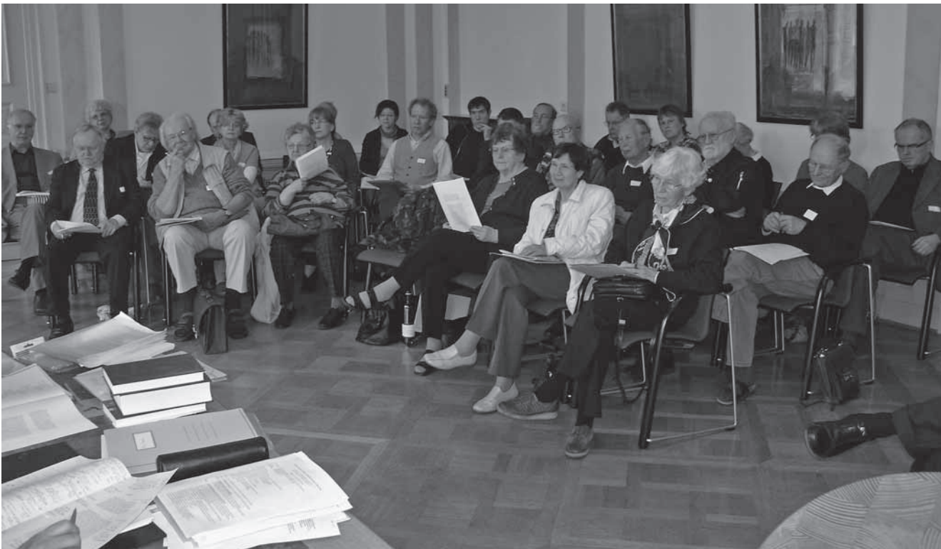
dbv-Frühjahrstagung in Hofgeismar Blick in die Teilnehmerrunde