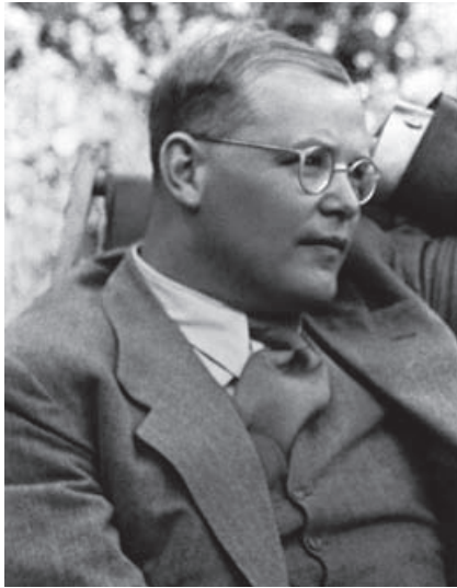
Dietrich Bonhoeffer im Juli 1939

„Ich glaube, dass Gott uns in jeder Notlage soviel Widerstandskraft geben will, wie wir brauchen. Aber er gibt sie nicht im Voraus, damit wir uns nicht auf uns selbst, sondern auf ihn verlassen. In solchem Glauben müsste alle Angst vor der Zukunft überwunden sein.“