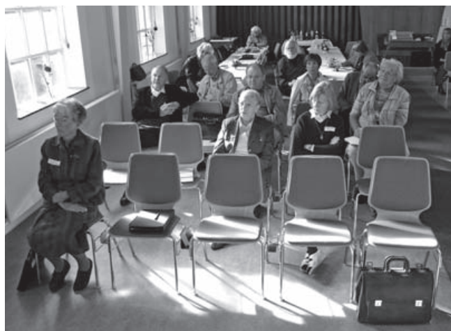
Werkstatt-Tagung dbv – Blick in die Teilnehmerrunde