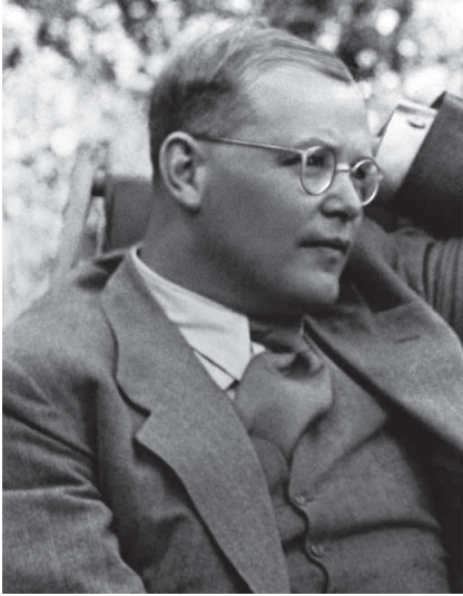
Dietrich Bonhoeffer im Juli 1939

„Ich glaube, dass Gott uns in jeder Notlage soviel Widerstandskraft geben will, wie wir brauchen. Aber er gibt sie nicht im Voraus, damit wir uns nicht auf uns selbst, sondern auf ihn verlassen. In solchem Glauben müsste alle Angst vor der Zukunft überwunden sein.“