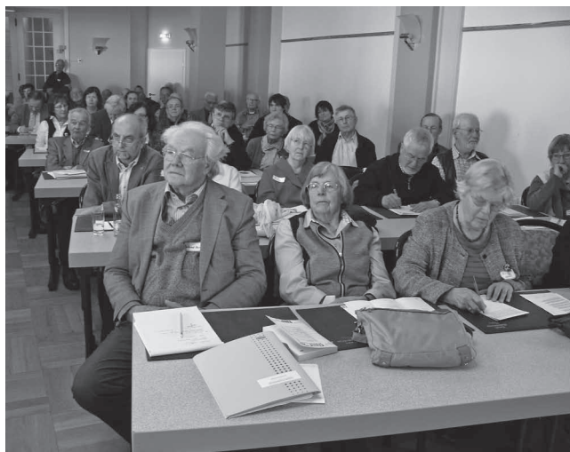
Frühjahrstagung dbv – Blick in die Teilnehmerrunde

Durch Bischof Dibelius sei Brunotte dann doch wieder mit Leitungsaufgaben innerhalb der evangelischen Kirche beauftragt worden. Zwischen 1949 und 1965 sei Brunotte zunächst Präses der Kirchenkanzlei, spä-