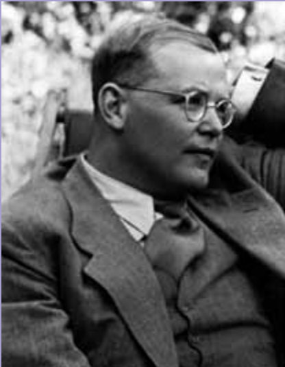
Dietrich Bonhoeffer im Juli 1939

„Ich glaube, dass Gott uns in jeder Notlage soviel Widerstandskraft geben will, wie wir brauchen. Aber er gibt sie nicht im Voraus, damit wir uns nicht auf uns selbst, sondern auf ihn verlassen. In solchem Glauben müsste alle Angst vor der Zukunft überwunden sein.“