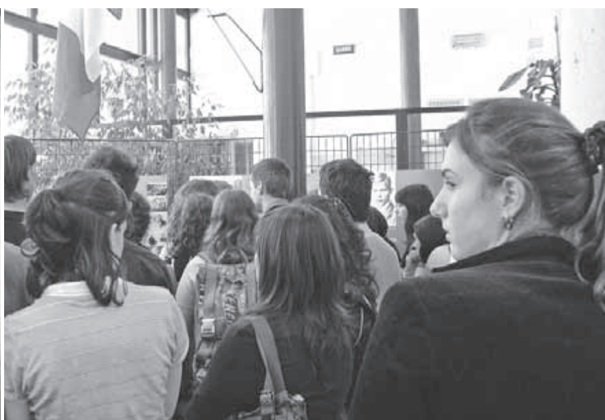
Plakat der Ausstellung in Desenzano del Garda und Schülerinnen sowie Schüler vor den Bonhoeffer-Tafeln