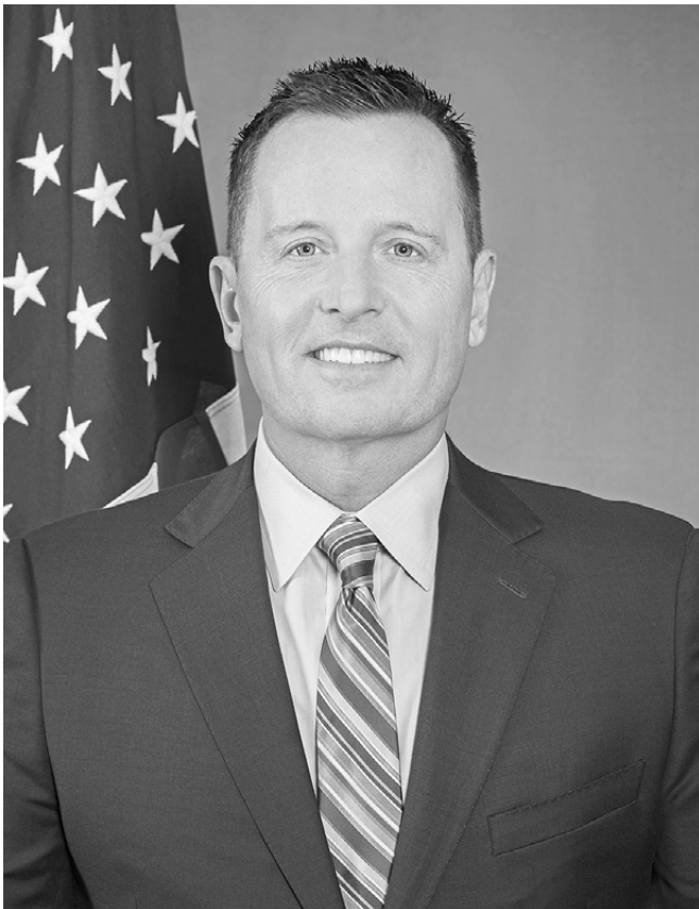
Richard Grenell 2018

Vermutlich hat Donald Trump noch nie etwas von Dietrich Bonhoeffer gehört. Trotzdem hängt seit diesem Jahr eine bronzene Tafel zu Ehren des von den Nazis ermordeten Widerstandskämpfers in der Gedenkstätte Flossenbürg in der Oberpfalz, die den Namen des US-Präsidenten trägt. Sein Statthalter in Berlin, der umstrittene Botschafter Richard Grenell, hatte sich dafür eingesetzt und sie in einer Feierstunde enthüllt. In seiner Rede wählte er Bonhoeffer-Zitate, deren Bedeutung plötzlich