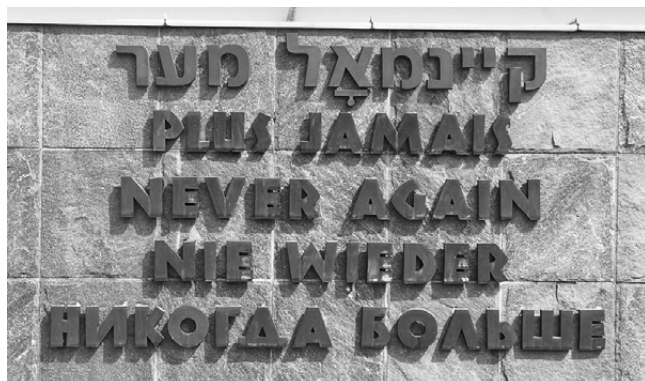
Teil des Internationalen Mahnmals in der KZ-Gedenkstätte Dachau

verhindert werden. Die Oppositionellen sollten so zum Verstummen gebracht werden. Außerdem wurde durch den „Arierparagraphen“ innerhalb der Kirche Pfarrern jüdischer Herkunft die Verkündigung des Evangeliums verboten. Diese sollten so durch den „Arierparagraphen“ in der Kirche zum Verstummen gebracht werden.