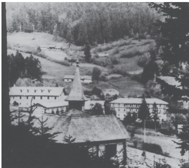
Čiernohorské Kúpele, Evangelische Kirche. Versammlungsort der Friedenskonferenz.

Der „Weltbund für Freundschaftsarbeit der Kirchen“ (World Alliance for Promoting International Friendship through the Churches) war eine ökumenische Friedensbewegung, die – hervorgegangen „aus spontanen Friedensbemühungen amerikanischer, deutscher, englischer und Schweizer Christen“ – am 1. August 1914 in Konstanz gegründet worden war – zu spät, um den Ausbruch des Krieges noch verhindern zu können. So musste sich der Weltbund während des Krieges auf „Hilfe für die Opfer des Krieges“ beschränken, bevor er sich 1919 in Holland erneut zu einer internationalen Tagung versammeln konnte. Der 1928 in Prag abgehaltene „Weltkongress für Friede und Freundschaft“ verabschiedete eine durch eine von 500 Kirchenvertretern einstimmig angenommene Abrüstungsresolution. 4