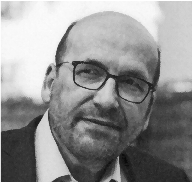
Günter Thomas (Quelle: „Im Weltabenteuer Gottes leben – Impulse zur Verantwortung für die Kirche“ von Günter Thomas, Evangelische Verlagsanstalt, 2021).