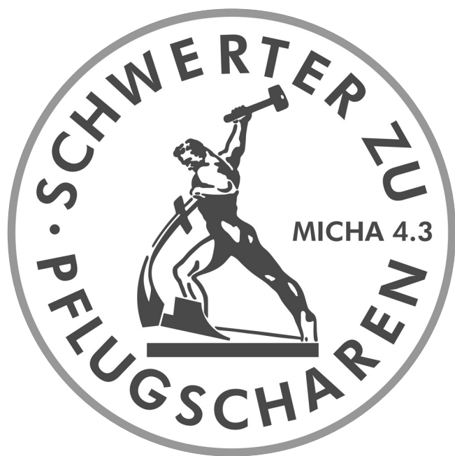
Symbol der DDR-Friedensbewegung „Schwerver zu Pflugscharen“ (Quelle: http://www.kirche-sebnitz.de ).

Marquard, der Bonhoeffer durch die Brille der allzu simplen Max-Weber-Unterscheidung von Gesinnungs- und Verantwortungsethik liest, verkehrt Bonhoeffers kritischen Einwand ins gerade Gegenteil. Nur so kann im Namen des Pazifisten Bonhoeffer Waffenlieferungen heute das Wort geredet werden.