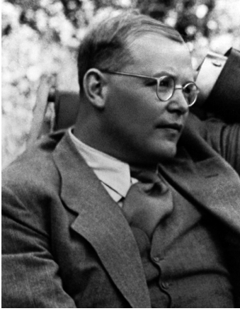
Dietrich Bonhoeffer im Juli 1939

„Ich glaube, dass Gott uns in jeder Notlage soviel Widerstandskraft geben will, wie wir brauchen. Aber er gibt sie nicht im Voraus, damit wir uns nicht auf uns selbst, sondern auf ihn verlassen. In solchem Glauben müsste alle Angst vor der Zukunft überwunden sein.“