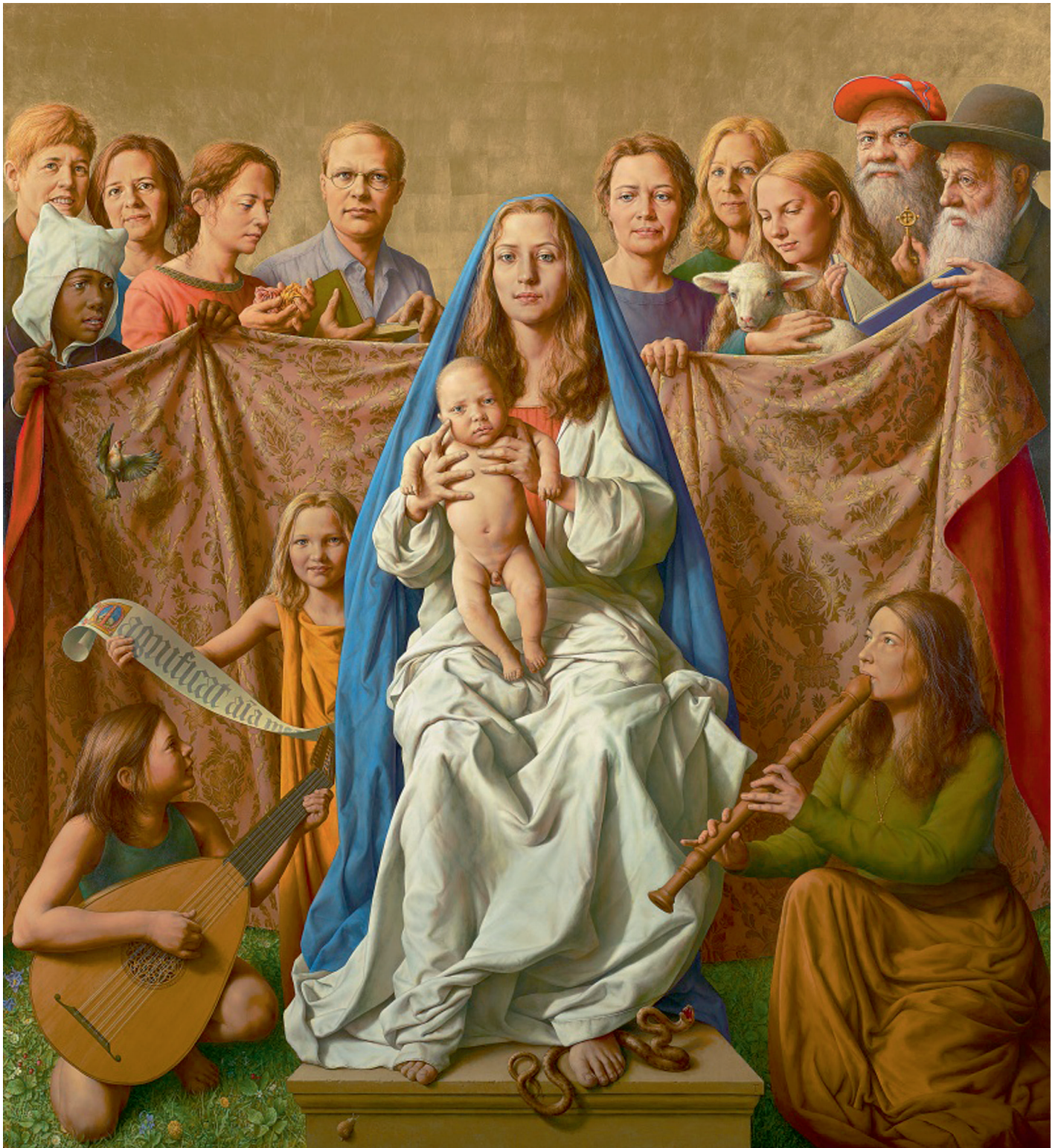
Michael Triegel: Altar Naumburg, Sacra conversazione, Vorderseite