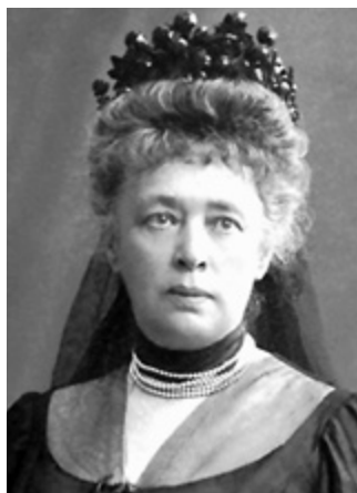
Bertha von Suttner