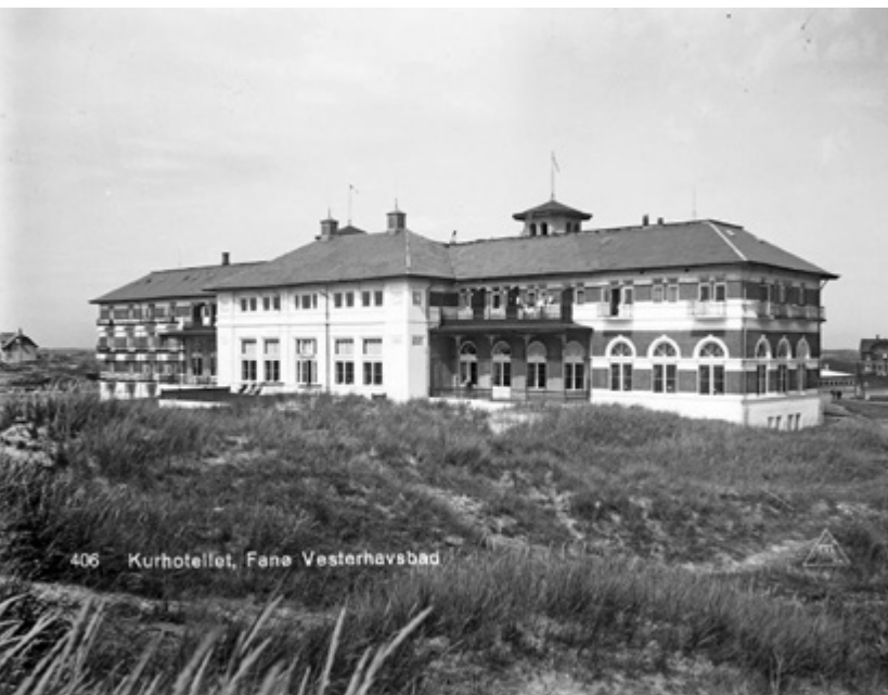
406 Kurhotellet, Fana Vesterhavsbad

Im Kurhotel Fana tagten vom 24. bis zum 30. August 1934 die Konferenz des Ökumenischen Rates für Praktisches Christentum sowie der Arbeitsausschuss des Weltbundes für Freundschaftsarbeit der Kirchen.